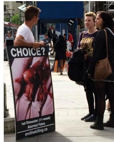
▲ In gesprek op straat

Hoewel het vele werk soms overweldigend is, voelen we ons bemoedigd door de vele vruchten die we in de afgelopen tijd hebben gezien en waarvan we hebben gehoord. In de laatste paar weken alleen al hebben drie moeders gezegd dat ze de abortus niet konden doorzetten nadat ze onze foto's op straat hadden gezien.