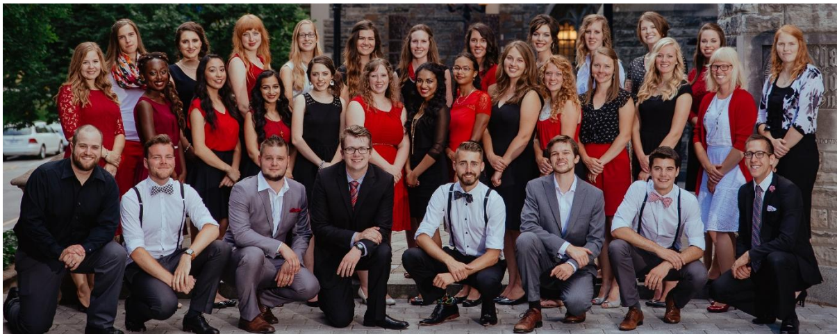
▲ Ons team in het oosten van het land

Het is slechts één van de vele verhalen die we zouden kunnen vertellen van de afgelopen zomer. In Toronto hadden we negentien zomerstafleden in drie verschillende programma's: middelbare scholieren, studenten én voormalige stagiairs die al eerder bij CCBR hadden gewerkt en nu een vervolgtraining kregen. In Calgary werkten zes zomerstafleden mee aan de middelbareschool- en universiteitsprogramma's. Samen met de fulltimers waren er dus door het hele land totaal 44 mensen bezig met pro-lifewerk ...van wie Nick met zijn 30 jaar de oudste was!